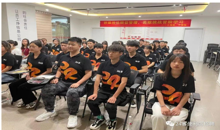
第一届青苗计划开营仪式

24客新苗人才计划，是24客为加强人才培育而制定实施的一项人才发展战略规划，旨在加强产教融合，招募最具学习能力、成长能力的优秀人才，“新苗”们将在1年时间内完成定制化的职业发展与学习路径，充分挖掘自身潜力、提升专业能力和领导力，考核合格从而实现高速职业发展，造就一大批24客快速发展急需的紧缺人才和拔尖管理人才，为24客2025年战略目标的实现提供强大人才支撑！