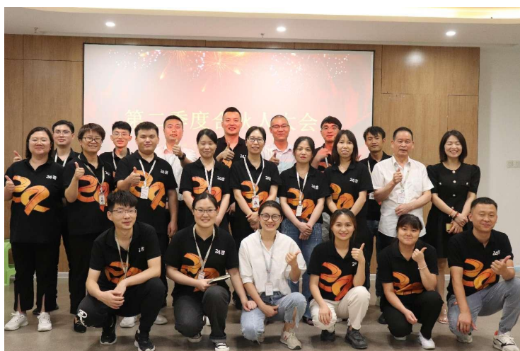
总部合伙人大会暨新合伙人仪式

坚持人才培养战略，坚持“人人都是合伙人，人人都是经营者”的经营理念，是24客便利店快速发展的动力和基石。