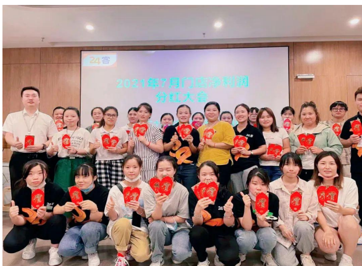
门店合伙人净利润分红大会

24客便利通过门店净利润分红、合资入股、管理股激励、区域合伙等多种合伙人模式，近十年来，培养了近百名门店合伙人、总部合伙人、区域合伙人。