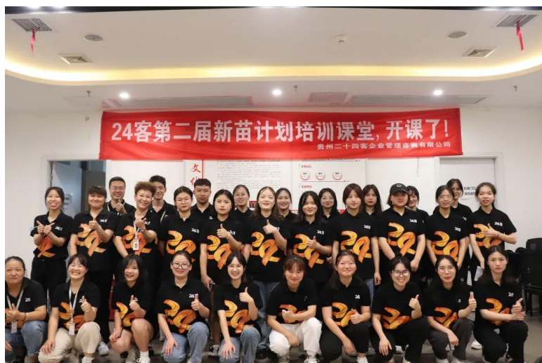
第二届青苗计划开营仪式